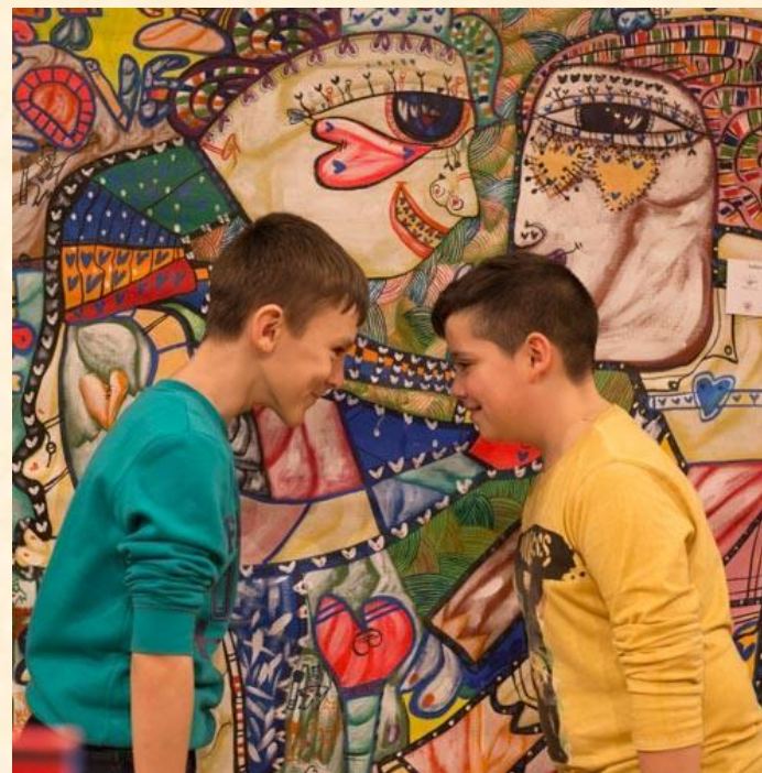
La Muzeul Municipal Iași- 22.01-25.01.2018