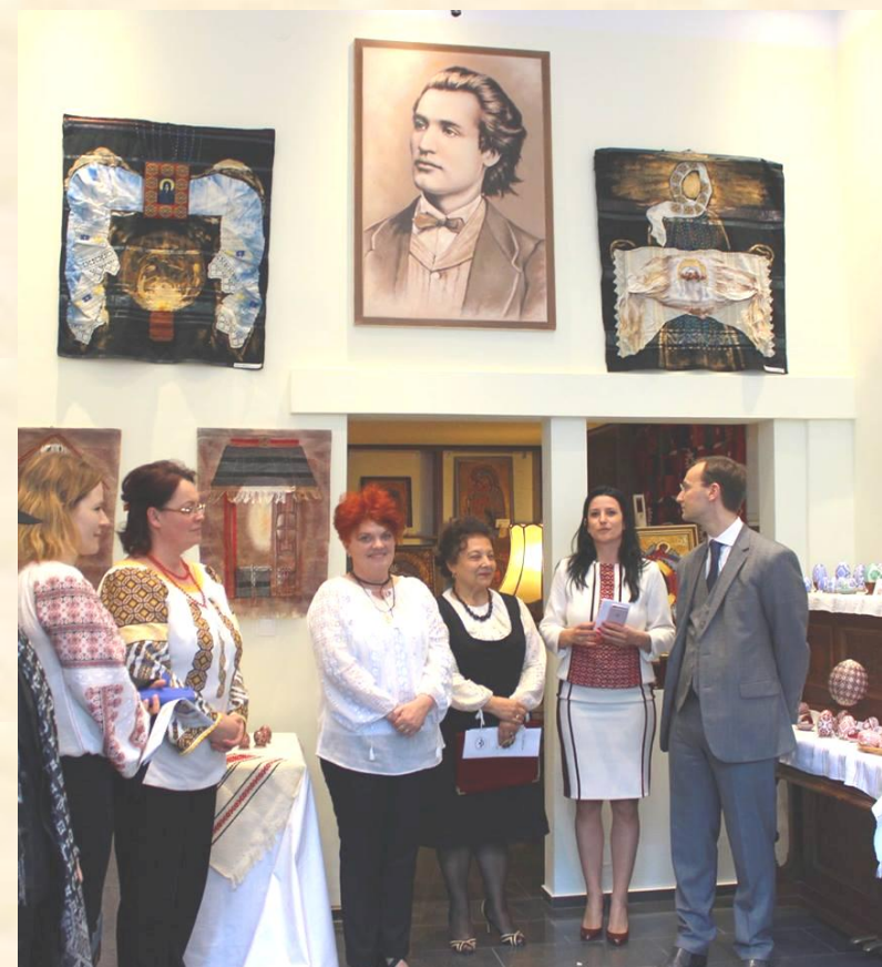
Vernisajul expoziției ”Primăvara românească” a avut loc la sediul Asociației ”Mihai Eminescu” din Viena de pe Martinstrasse nr.